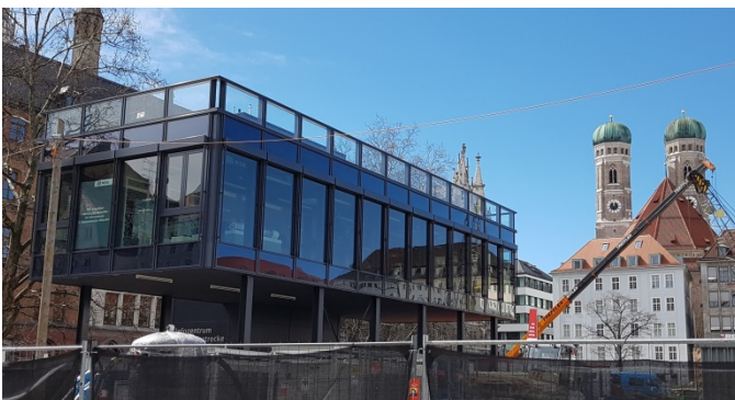
Das Infozentrum am Marienhof ist geöffnet von Donnerstag bis Samstag, 13.00-19.00 Uhr