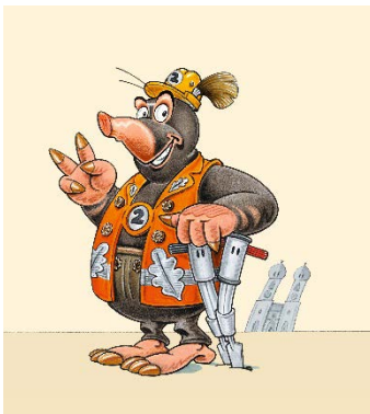
(Grafik: DB AG)

Rund um die Bautätigkeiten informiert das Team der 2. Stammstrecke in Zukunft mit dem extra für die 2. Stammstrecke neu gezeichneten „Baustellenbotschafter Max Maulwurf“. Er wird heute im Infozentrum 2. Stammstrecke zum ersten Mal zu sehen sein.