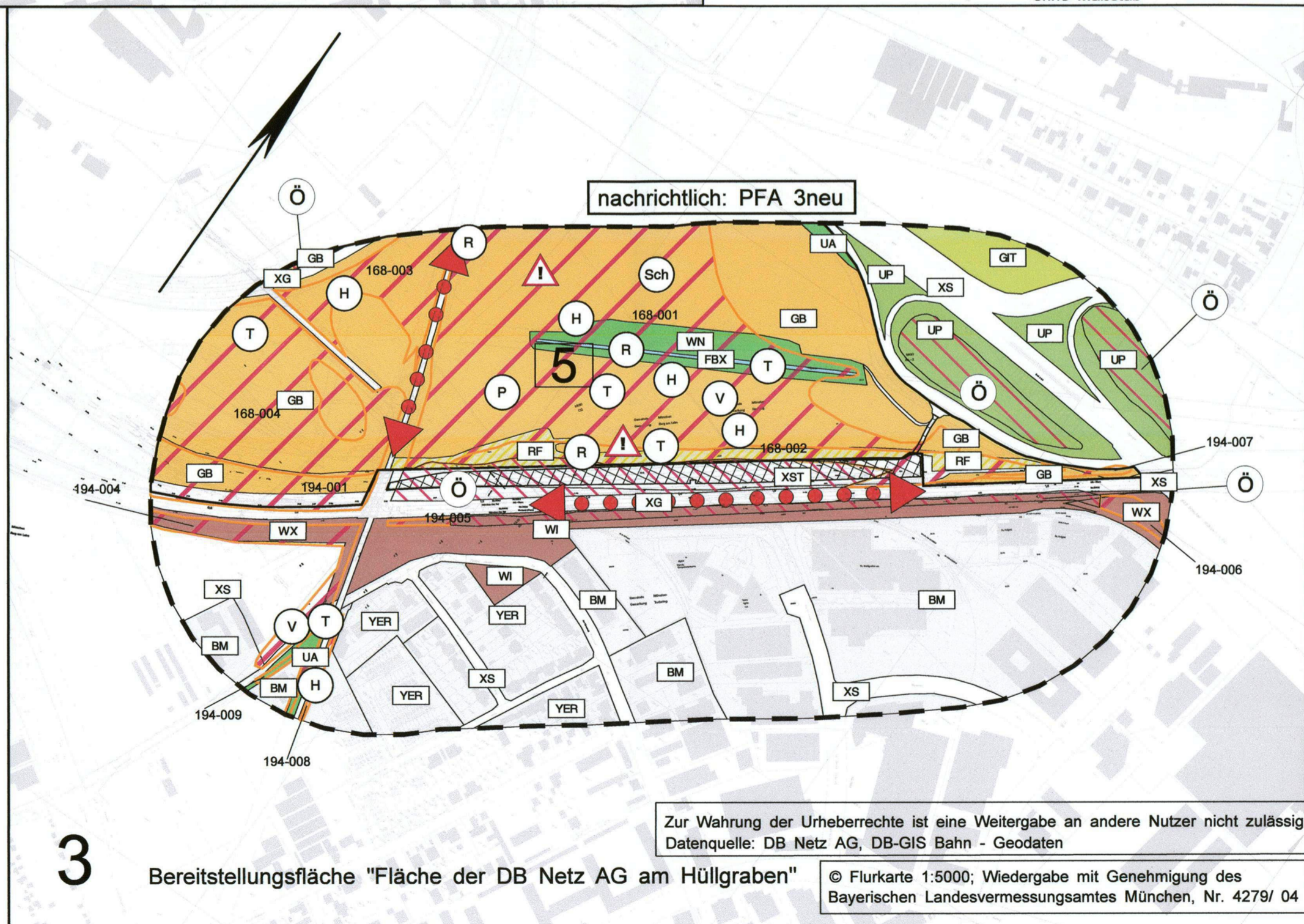
3 Bereitstellungsfäche "Fläche der DB Netz AG am Hüllgraben"